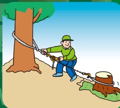
引張り 引寄せ作業